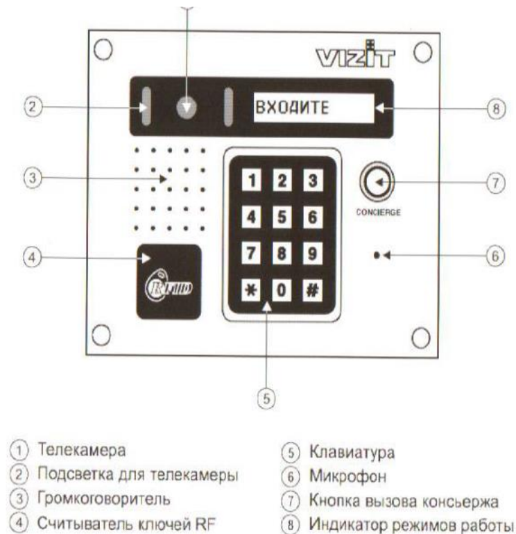
Рис. 5 Внешний вид и органы управления блока.