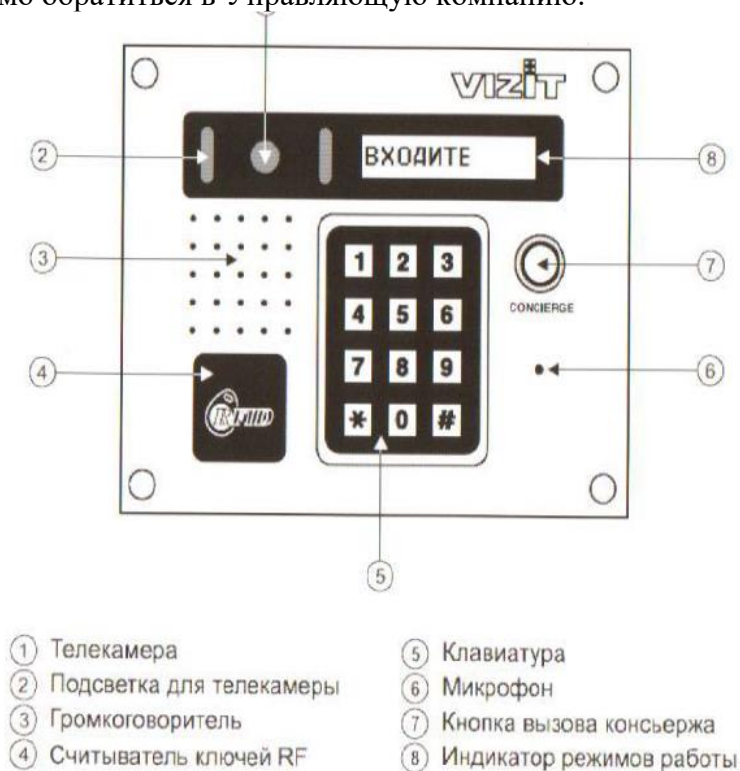
Рис. 5 Внешний вид и органы управления блока.

ВНИМАНИЕ: Ремонтные работы КПУ разрешается выполнять только представителям специализированной организации. При установлении неисправности системы необходимо обратиться в Управляющую компанию.