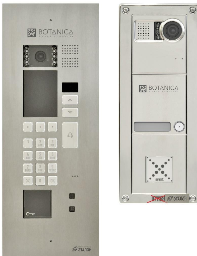
Рис. 5 Внешний вид и органы управления блока.

ВНИМАНИЕ: Ремонтные работы КПУ разрешается выполнять только представителям специализированной организации. При установлении неисправности системы необходимо обратиться в Управляющую компанию.