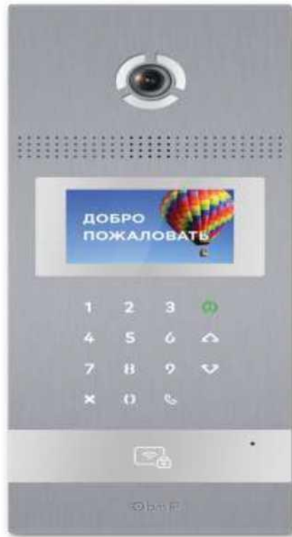
Рис. 5 Внешний вид вызывной панели.